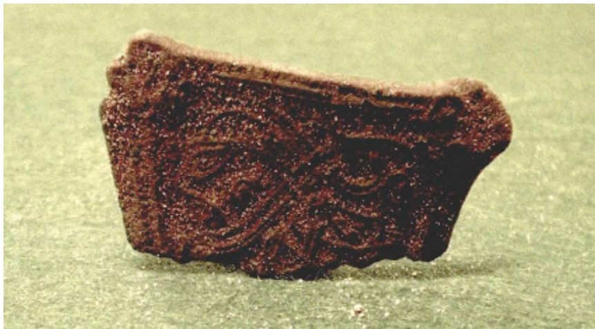
Deler av ei beltespenne, som er datert til merovingertida, er så langt den mest spennende gjenstanden som er funnet på den store boplassen.