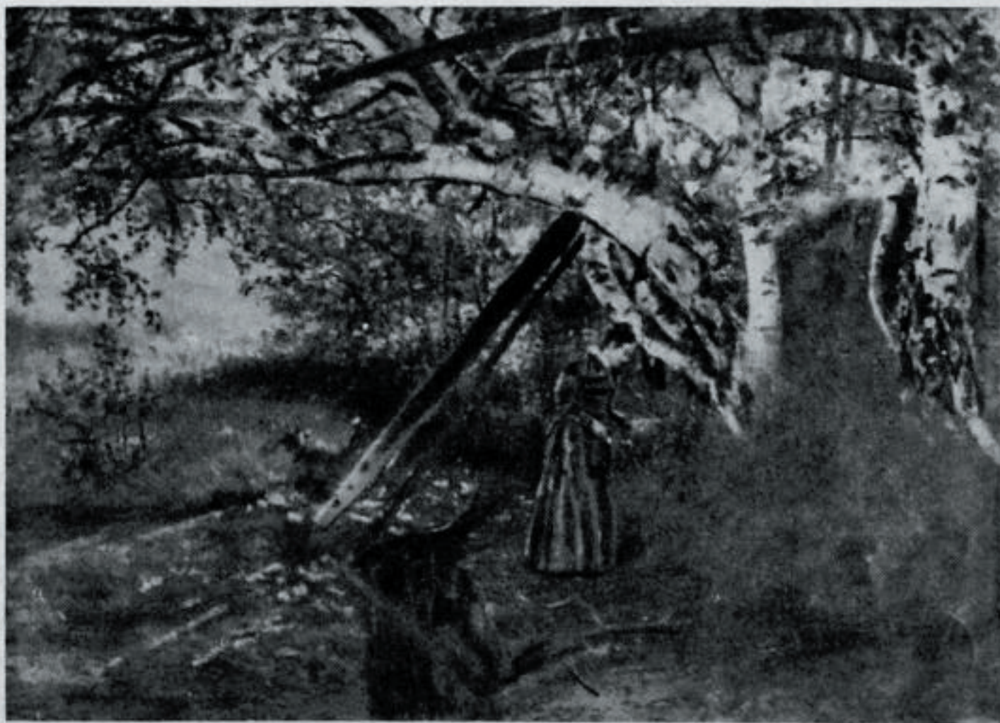
Fra Fiskum prestegårds have for 60 år siden.