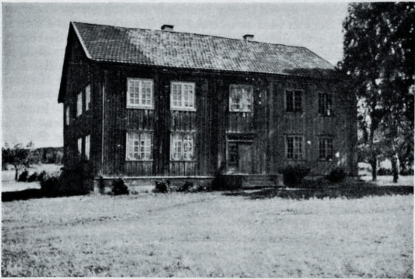
Hovedbygning fra Vollstad, Ø. Eiker. Gammel Eiker-stil