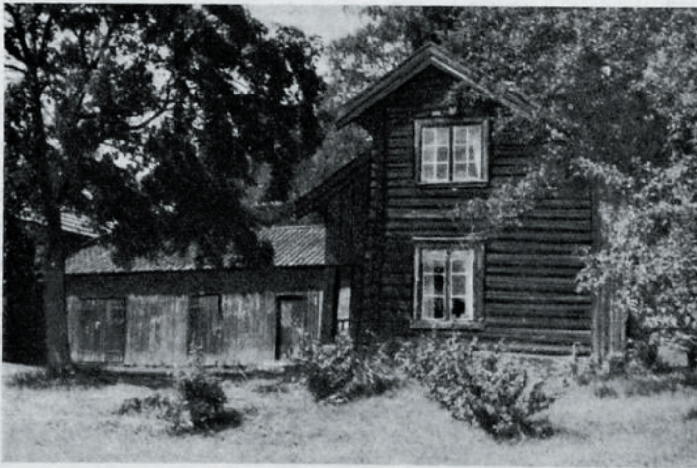
Bekken under Lo. Gammel Eiker-stil