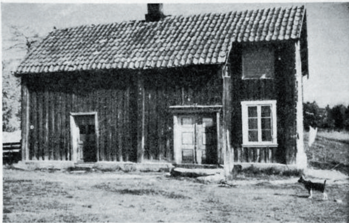
Kofstadmoen, Darbu, Ø. Eiker