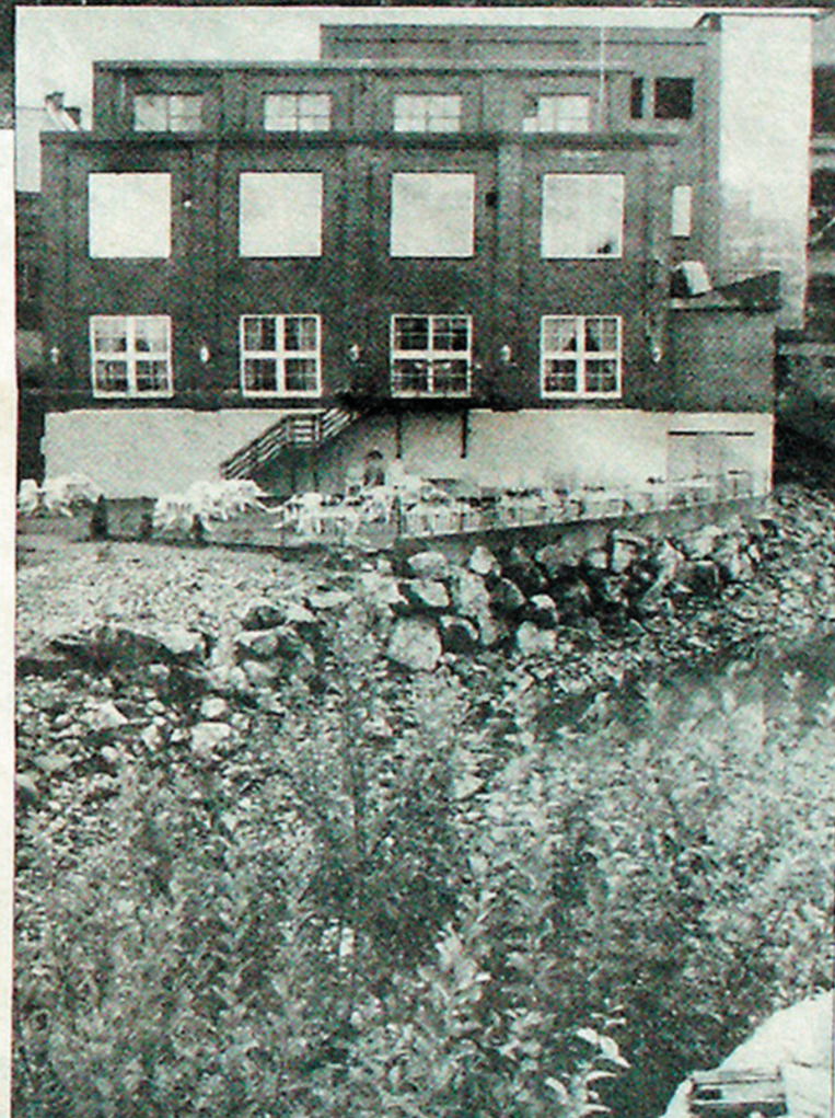
Diskotek med uteservering. En livlig idyll midt inne på industriområdet.

Men smått om senn går det altså framover. Når lokalene etter hvert tas i bruk, når det settes inn nye vinduer, og når det etter hvert ryddes opp utenfor, vil Vestfossen få et nytt og ungdommelig ansikt. De gamle ruine har langt fra vært noe syn for øyet for folk flest.